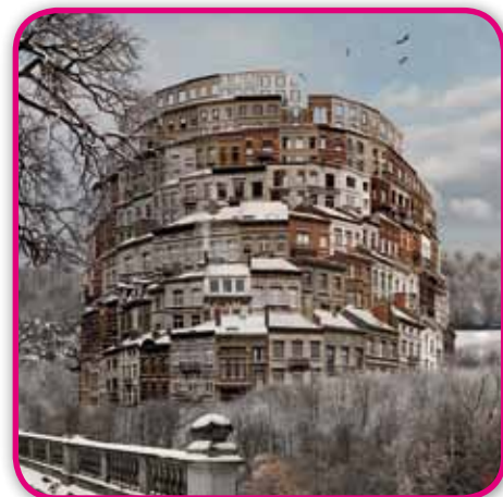
ESPACE ART 22 - Eric DE VILLE - Détail

Avec JACOB , le design entre par la grande porte à l'AAF grâce à Jacques Gansberg qui conçoit et réalise dans ses ateliers du mobilier en pièces uniques à la combinaison audacieuse et voluptueuse de l'acier et de l'aluminium, des œuvres qui décryptent l'histoire de la matière et de l'homme.