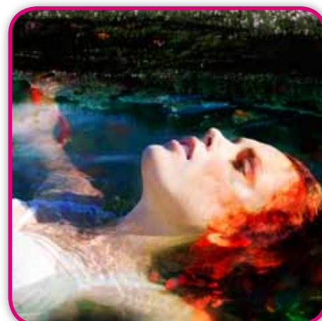
AICART & AJTINK - Hans WITHOOS - Détail