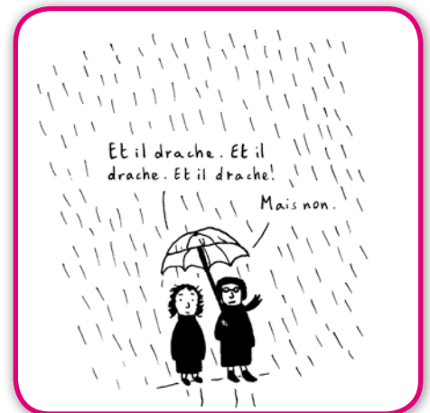
Emilie PLATEAU - Détail