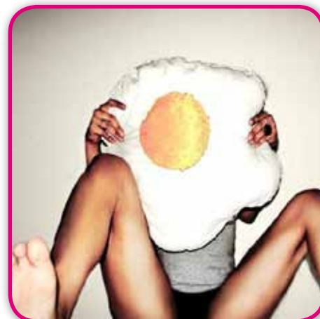
THE ART TREE - MAK - Détail

Sparkies Valérie Gadenne Mob : +32 (0)475 308 187 Tél. : +32 (0)2 346 90 85 vgadenne@sparkies.be