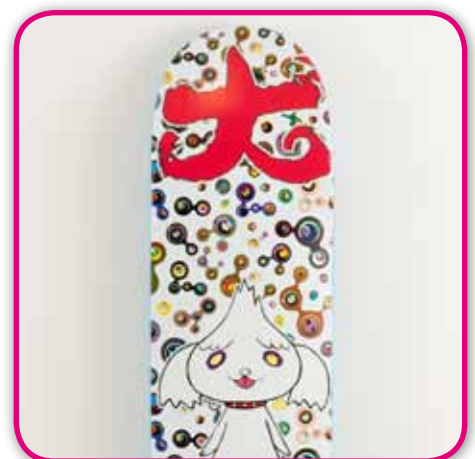
THESK8ROOM.COM - Takashi MURAKAMI - Détail