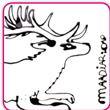
DCA GALLERY - Maadiar - Détail