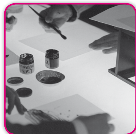
CENTRE DE GRAVURE ET DE L'IMAGE IMPRIMÉE DE LA LOUVIÈRE