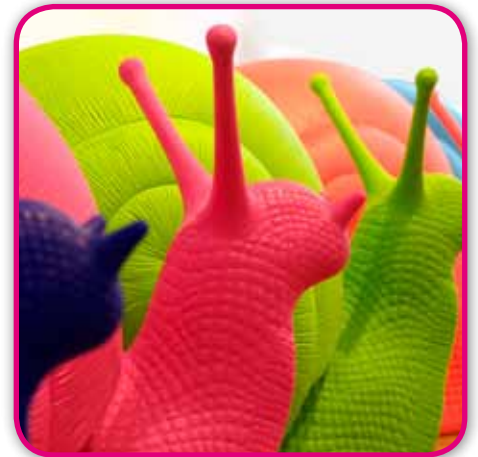
GALERIE GISONDI - Cracking Art Group - Détail