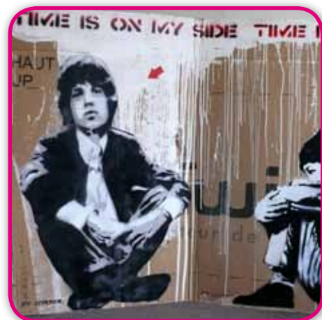
Jef AÉROSOL - Détail