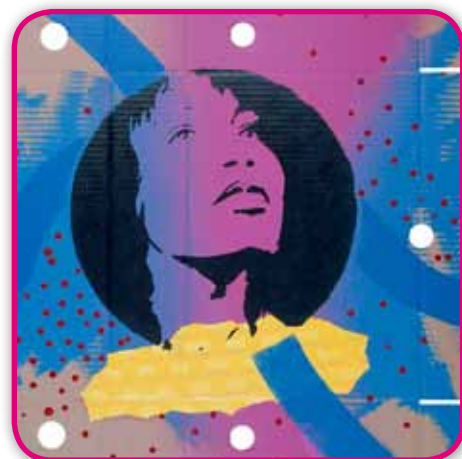
MAZEL GALERIE - Yvan MESSAC - Détail