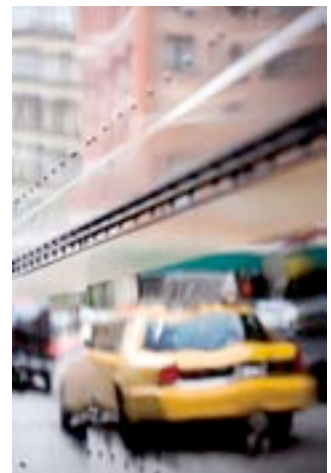
Manolo Chrétien Galerie Baltazar, Bruxelles

L'AAF prendra ses quartiers pendant 4 jours à Bruxelles et se renouvellera perpétuellement au rythme des œuvres vendues : une excellente raison de ne pas manquer son ouverture et de s'y rendre plus d'une fois à la découverte des grands artistes de demain!