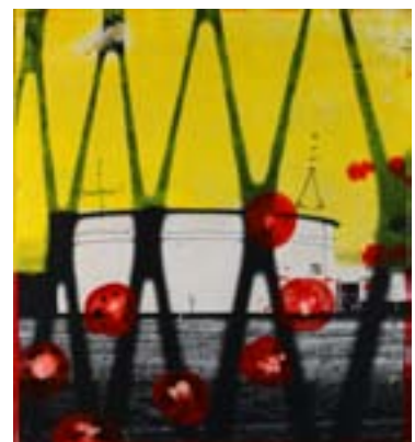
Edouard Buzon Galerie Envie d'Art, Bruxelles

L'édition belge sera organisée sous la houlette de Yann Bombard, le créateur en 2001 de « Envie d'art », une nouvelle génération de galeries partageant les mêmes valeurs et présent à Bruxelles depuis 1 an.