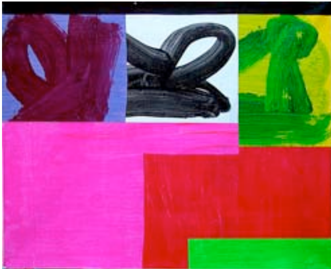
Carl Bruyninckx Galerie Pierre Hallet, Bruxelles

C'est un comité d'experts qui a sélectionné quelque 60 galeries belges et étrangères pour participer à cette première édition dans notre pays.